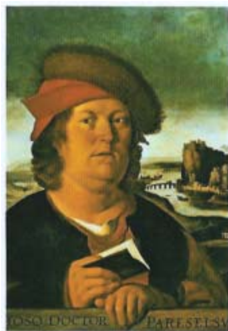
Paracelso según Rubens

Estas visitas eran muy normales y se realizaban constantemente comprobando el cumplimiento de las leyes que sobre las boticas había,